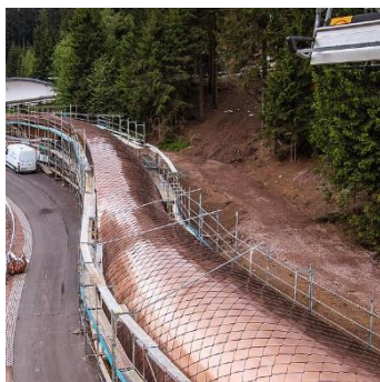
The new roofing of the LOTTO Thüringen EISARENA Oberhof

Die Farben können zwischen unterschiedlichen Produktionszeiträumen leicht variieren. Um die Farbeinheit zu gewährleisten, empfehlen wir den Gesamtbedarf in einem einzigen Auftrag zu bestellen und fertigen zu lassen.